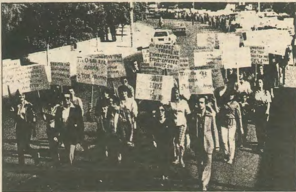
Απο την πικετοφορία των απεργών την περασμένη Πέμπτη

Για τους εργάτες η εμπειρία αυτής της απεργίας είναι μια χρήσιμη αφετηρία για προβληματισμό και κριτική των μέχρι τώρα απόψε-